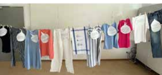
Beispielleine aus der Aktion „Wasserverbrauch“