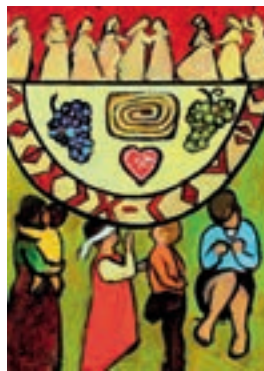
Das Titelbild zum Weltgebetstag 2019 „Come – Everything is ready“ stammt von Rezka Arnuš.

Demnach wurden in Niederbayern im Jahr 2017 1936 Fälle von häuslicher Gewalt gegen Frauen angezeigt. „Die Zahl ist im Vergleich zum Vorjahr um 200 angestiegen. Das ist einfach nur traurig“, stellte Weileder-Wurm klar. Da der Aktionsgruppe insbesondere am Herzen liegt, Hilfsangebote aufzuzeigen, gab es unter anderem einen Infostand im real-Markt in Passau-Neustift. Dort wurden Pflastermäppchen mit den wichtigsten Kontaktstellen in Stadt und Landkreis Passau verteilt. Zum Rahmenprogramm gehörten weiterhin ein Benefizkonzert mit der Gruppe „Crescendo“ zu Gunsten des Frauenhauses Passau und ein ökumenisches Abendgebet unter der Überschrift „Sammele meine Tränen in Deinem Krug“. Die Kollekte ging an Solwodi Passau. Zudem wurde der Film „Die Fremde“ gezeigt. Den Abschluss bildete eine Podiumsdiskussion, bei der insbesondere die Opferrechte im Hinblick auf Cybermobbing beleuchtet wurden. mam