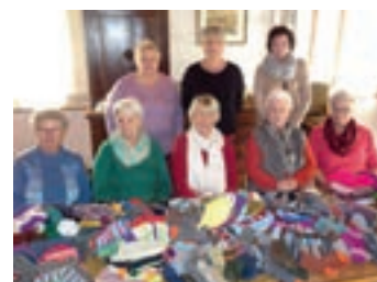
Die Strickerinnen aus Zeilarn sind mächtig stolz auf ihre gestrickten Teile.