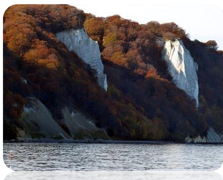
Insel Rügen, Kreidefelsen