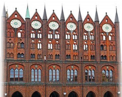
Stralsund, Rathaus